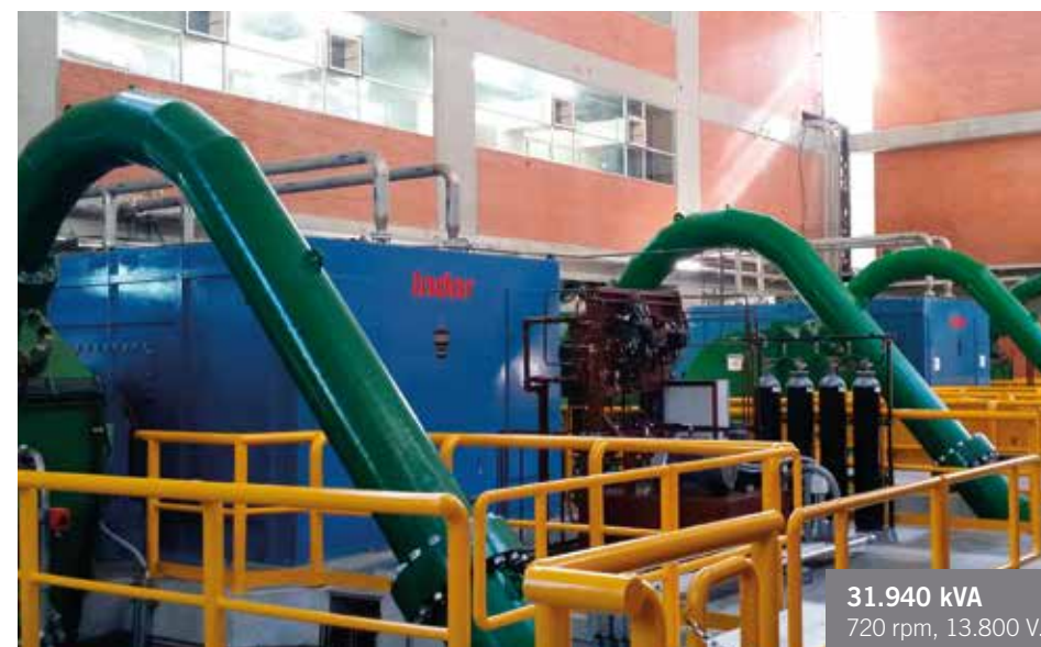
31.940 kVA 720 rpm, 13.800 V.