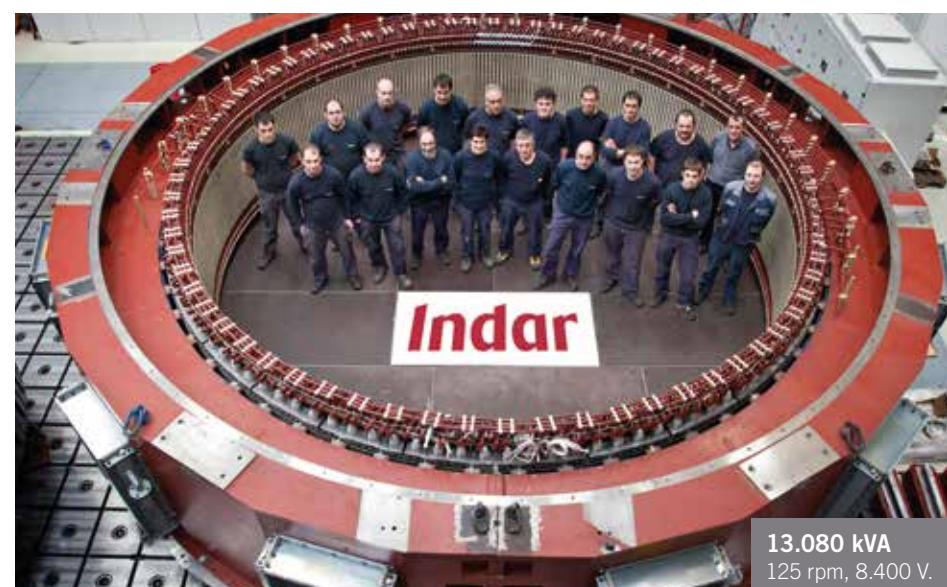
13.080 kVA 125 rpm, 8.400 V.

Rediseño de elementos activos y repotenciación de equipos bajo demanda.