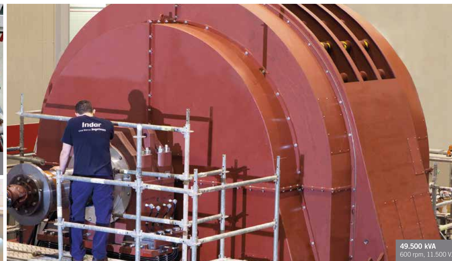
49.500 kVA 600 rpm, 11.500 V.