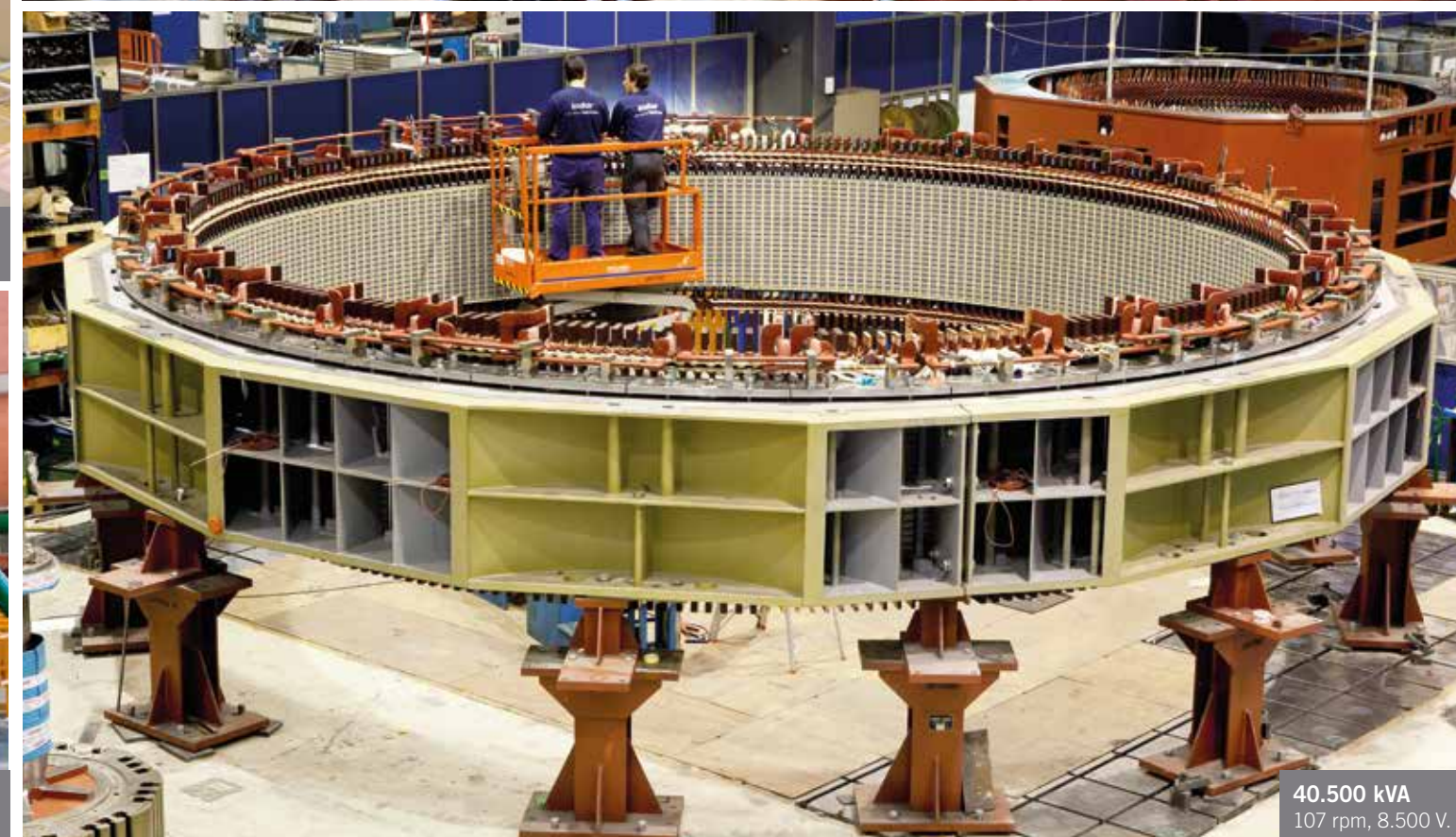
40.500 kVA 107 rpm, 8.500 V.