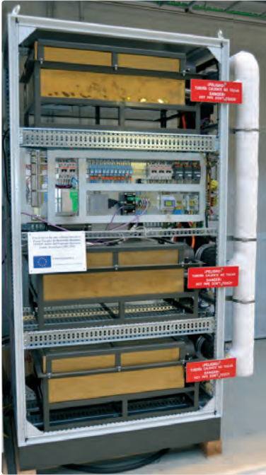
*Suministrado como integrador